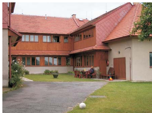
Výukové středisko Temešvár v jižních Čechách